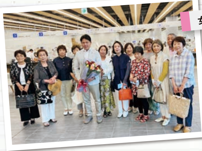
女性部会神戸支部 行政視察研修会