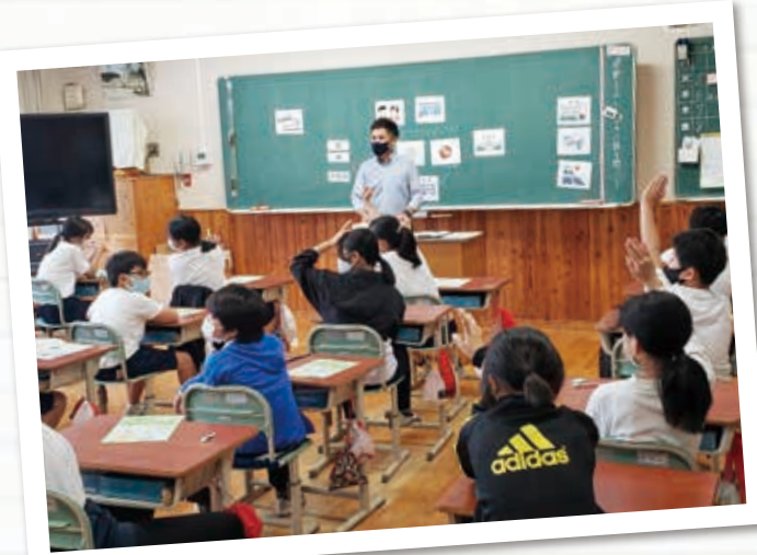
青年部会租税教室

令和4年7月5日、揖斐川町立揖斐小学校にて、青年部会員による租税教室を行いました。