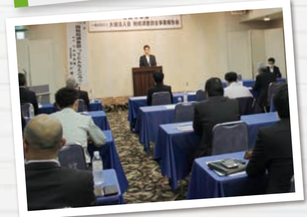
税経調査部会 事業報告会