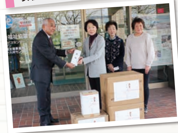
女性部会神戸支部地域社会貢献活動